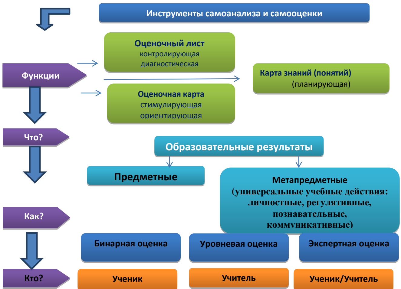
Схема 1. Классификация инструментов самоанализа и самооценки образовательных достижений учащихся

Основаниями для классификации инструментов оценивания могут быть разные признаки, которые представлены в схеме (Схема 1).