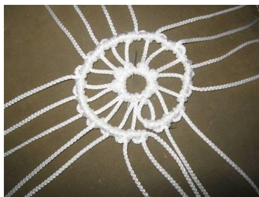
3. Плетём на 1-й нити все нити репсовым узлом (по 4 кольца). Зашиваем 1-й узел второго ряда и последний узел второго ряда