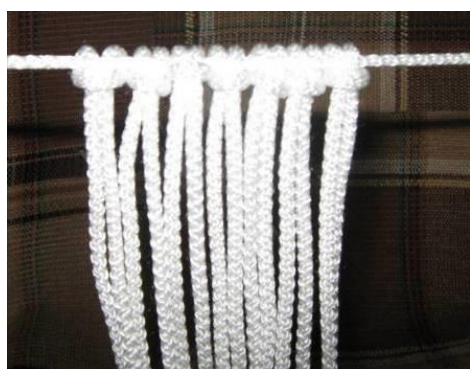
1. Нанизываем на основу (3 м.) 7 нитей по 3 м