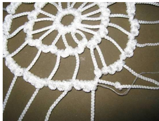
6. Зашиваем 1-й и последний узлы 3 ряда