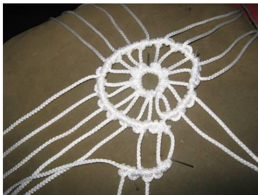
5. Третий ряд плетём репсовым узлом (5 колец)