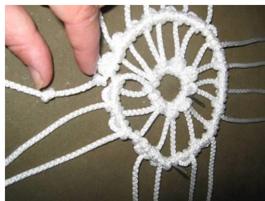
4. Второй ряд заканчиваем узлом «восьмёрка». 3-й ряд начинаем этим узлом