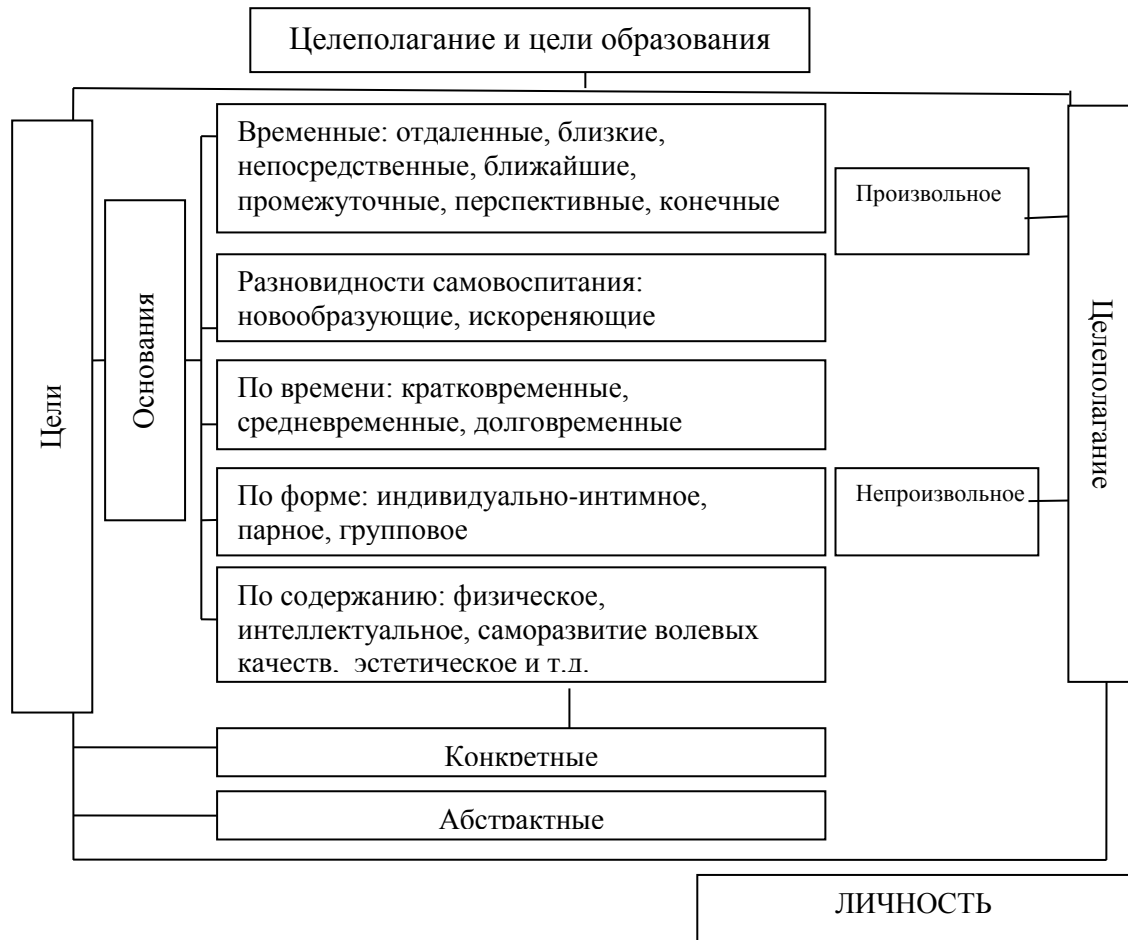
Рисунок 2 - Целеполагание и цели образования

В языке практического целеполагания используются такие обобщенные словосочетания, как: «собственно-педагогическая задача»; «функционально-педагогическая задача». Первое означает перевод студента из одного состояния в другое (не умел – научился, не знал – узнал, не владел – овладел и т.п.). Вторым словосочетанием обозначают разработанные для решения собственно-педагогических задач сценарии: упражнения для развития культуры речи, мероприятия по формированию опыта самоорганизации трудовой деятельности и т.п.