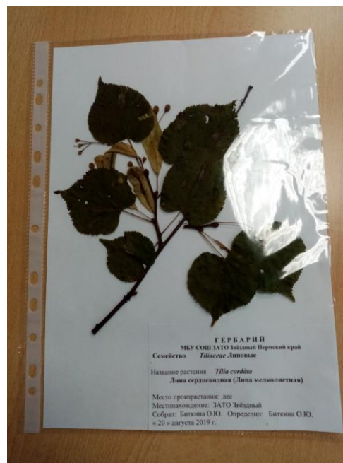
Плоды липы мелколистной, собранные в Театральном сквере г. Перми.